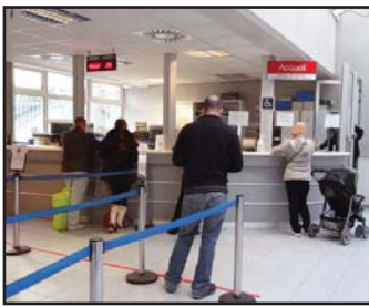
Accueil des guichets de la préfecture