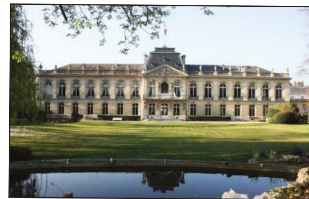
Façade de la préfecture vue du jardin

Dans les Yvelines, le Préfet peut s'appuyer sur trois sous-préfets d'arrondissements à Mantes-la-Jolie, Saint-Germain-en-Laye, Rambouillet. Le secrétaire général est le sous-préfet d'arrondissement de Versailles. Une sous-préfète est en charge de la Politique de la Ville.