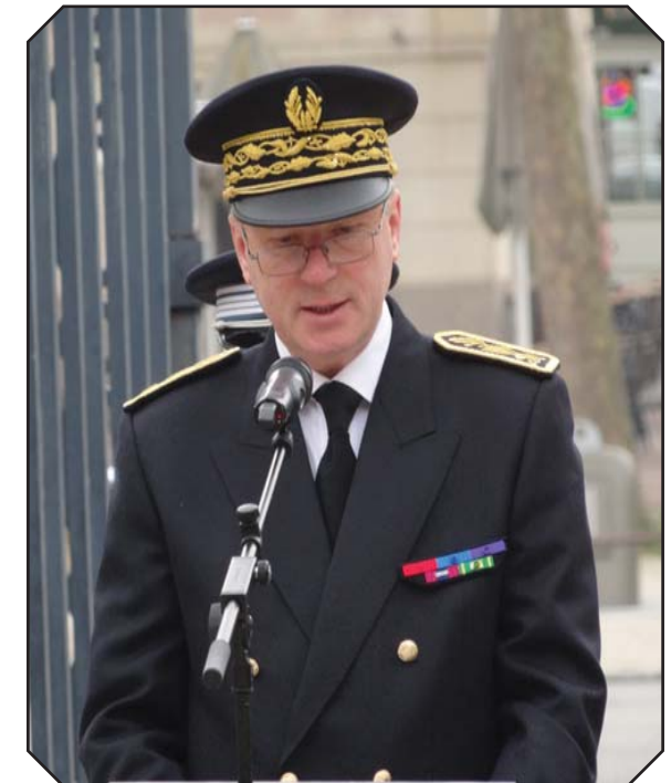
Erard CORBIN de MANGOUX, préfet des Yvelines depuis le 29 avril 2013, lors de la cérémonie d'hommage aux policiers morts pour la France et en service le 7 mai 2013 à Versailles